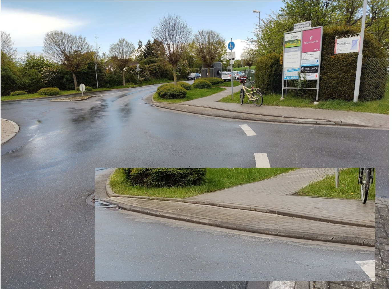
Bild 5: Usinger Straße, Kreiselausfahrt Richtung Oberloh / Usingen