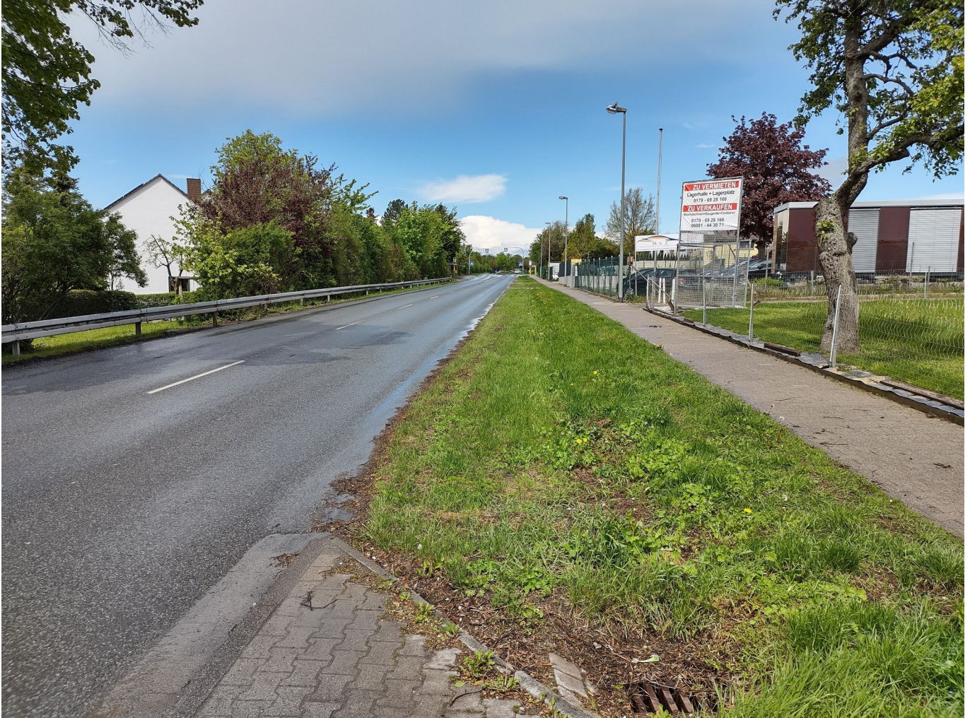
Bild 2: Usinger Straße, Abschnitt nördliche Ausfahrt des Baufachhandels Eckardt bis Kreisel