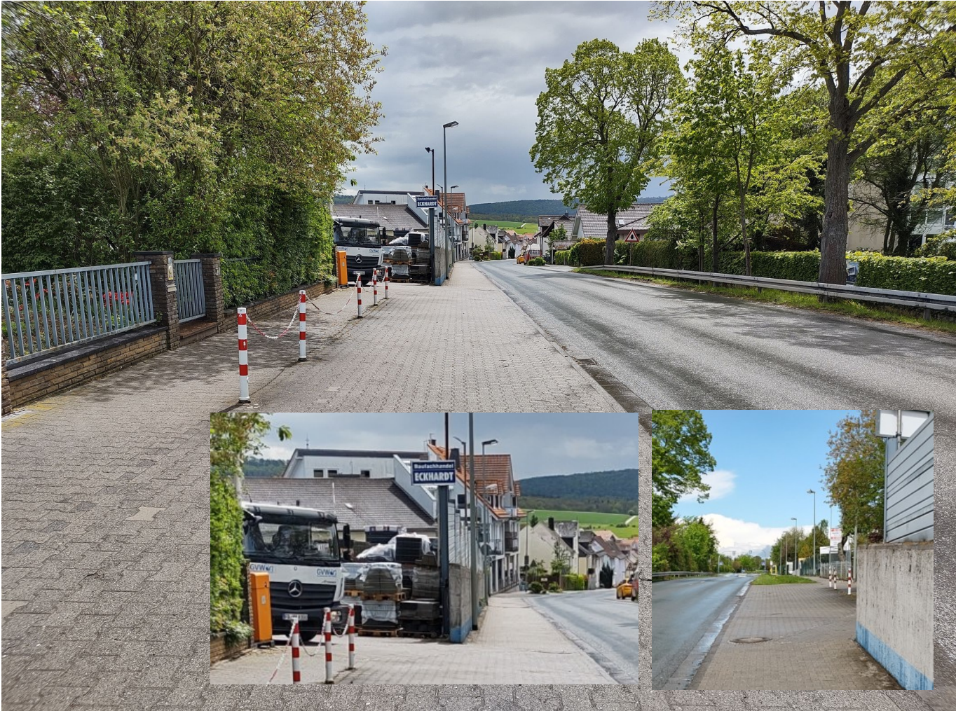
Bild 1: Usinger Straße, nördliche Ausfahrt des Baufachhandels Eckardt