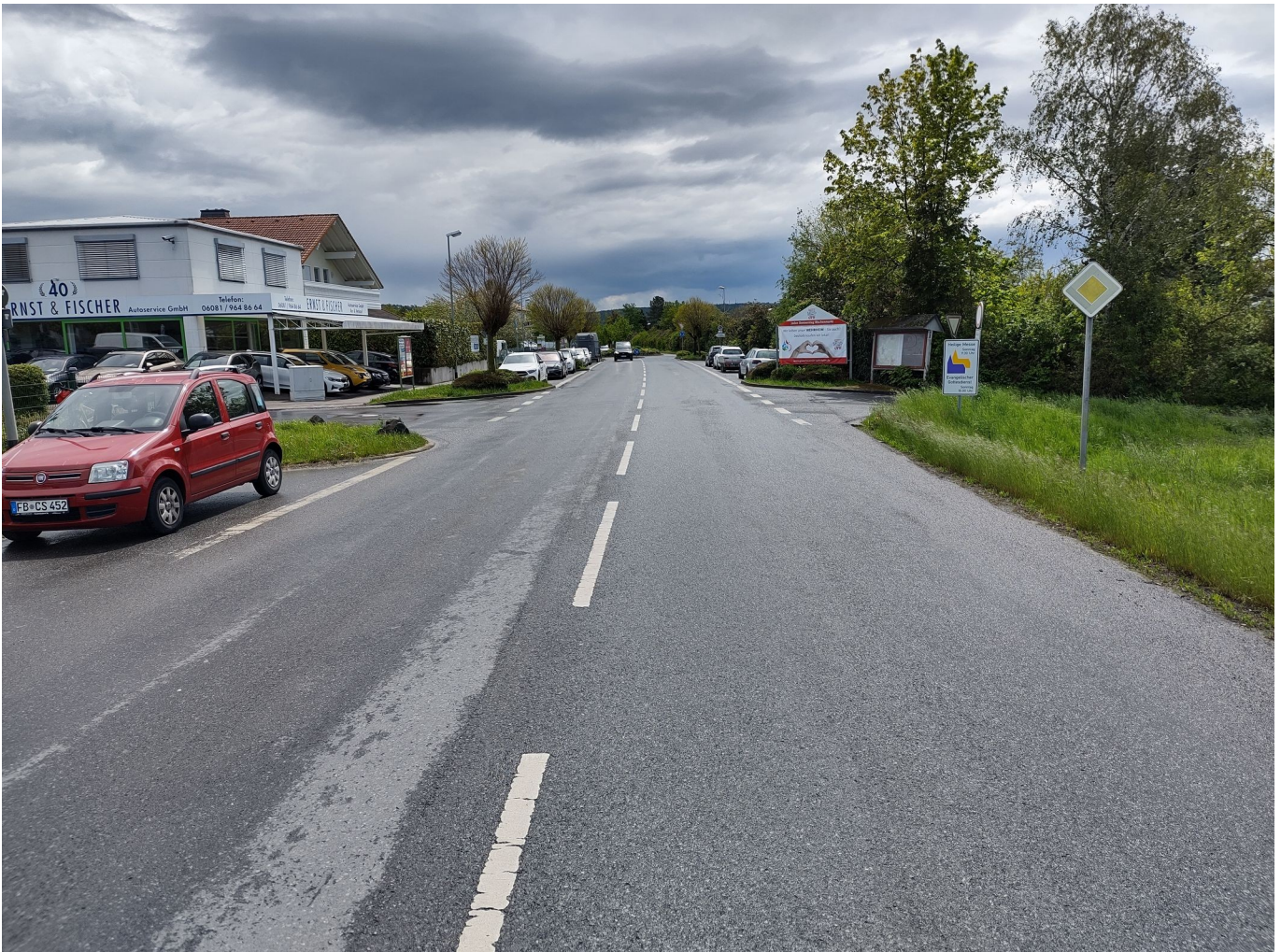
Bild 7: Usinger Straße / Rudolf-Diesel-Straße / Feldweg Richtung Westen